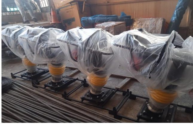
VIBRAPIZONES EN ALMACEN