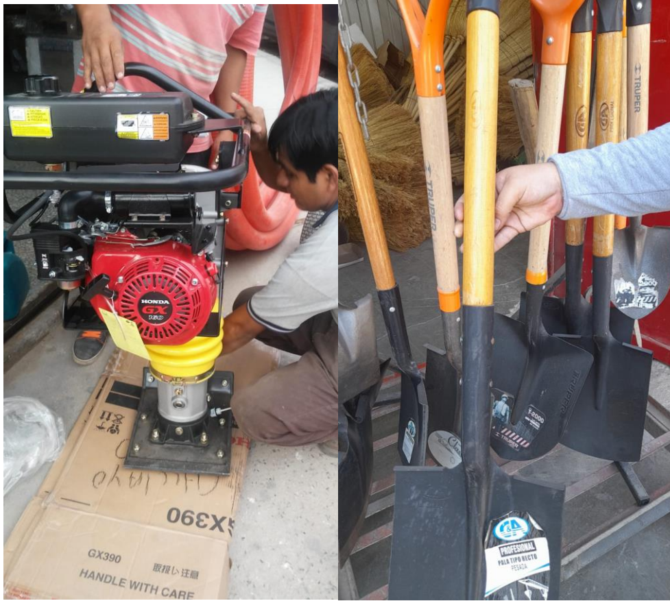
VIBRAPIZON// PALAS RECTAS Y TIPO CUCHARA