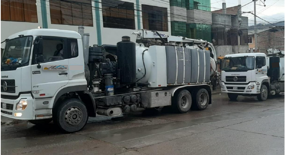
Imagen n° 01 Equipo HIDROJET