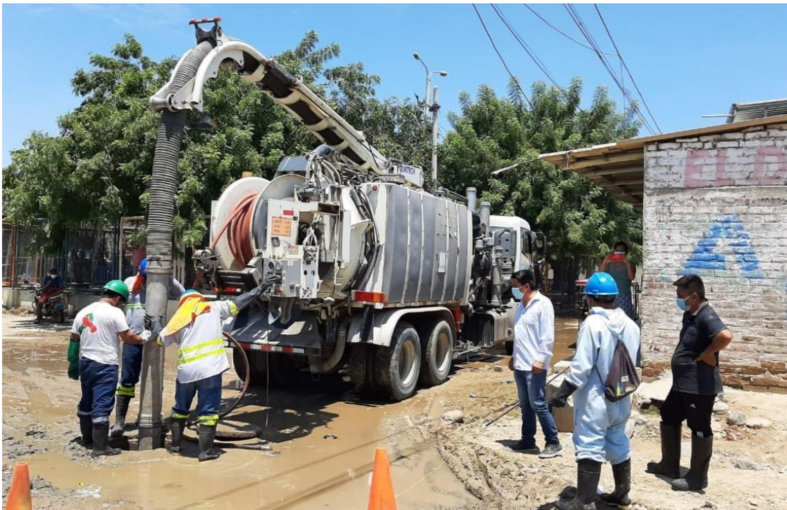
Imagen n° 02: Equipo HIDROJET en operación (referencial)