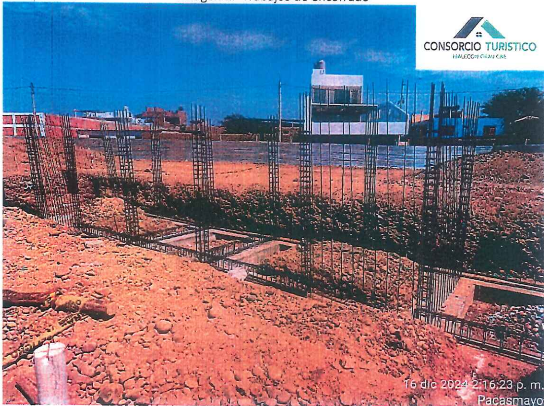
Imagen 2: Trabajos de habilitación e instalación de acero