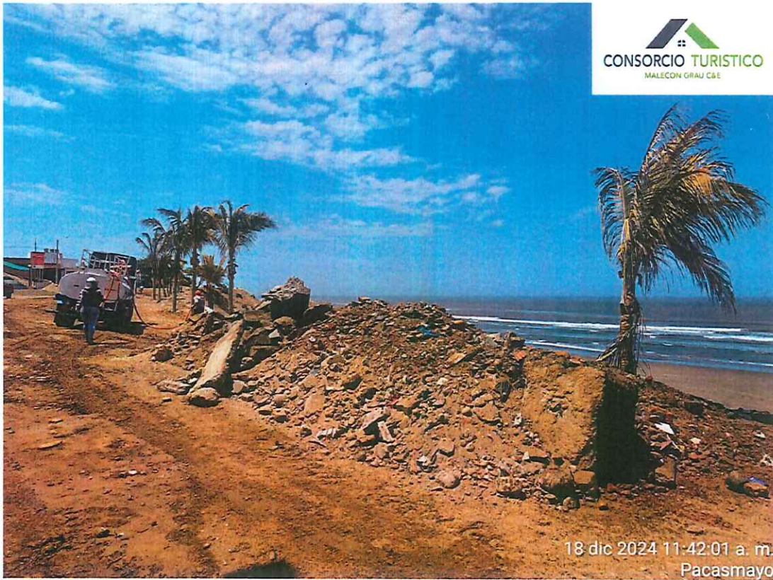
Imagen 1: Trabajos de movimiento de tierras c/maquinaria