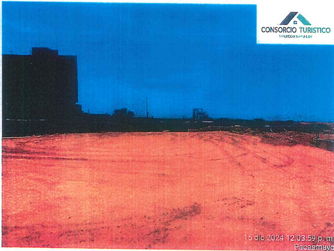
Imagen 1: Trabajos de movimiento de tierras relleno c/maquinaria