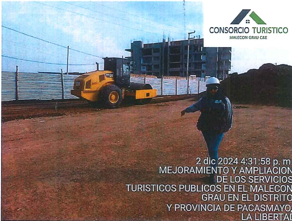
Imagen 1: Trabajos de movimiento de tierras relleno c/maquinaria