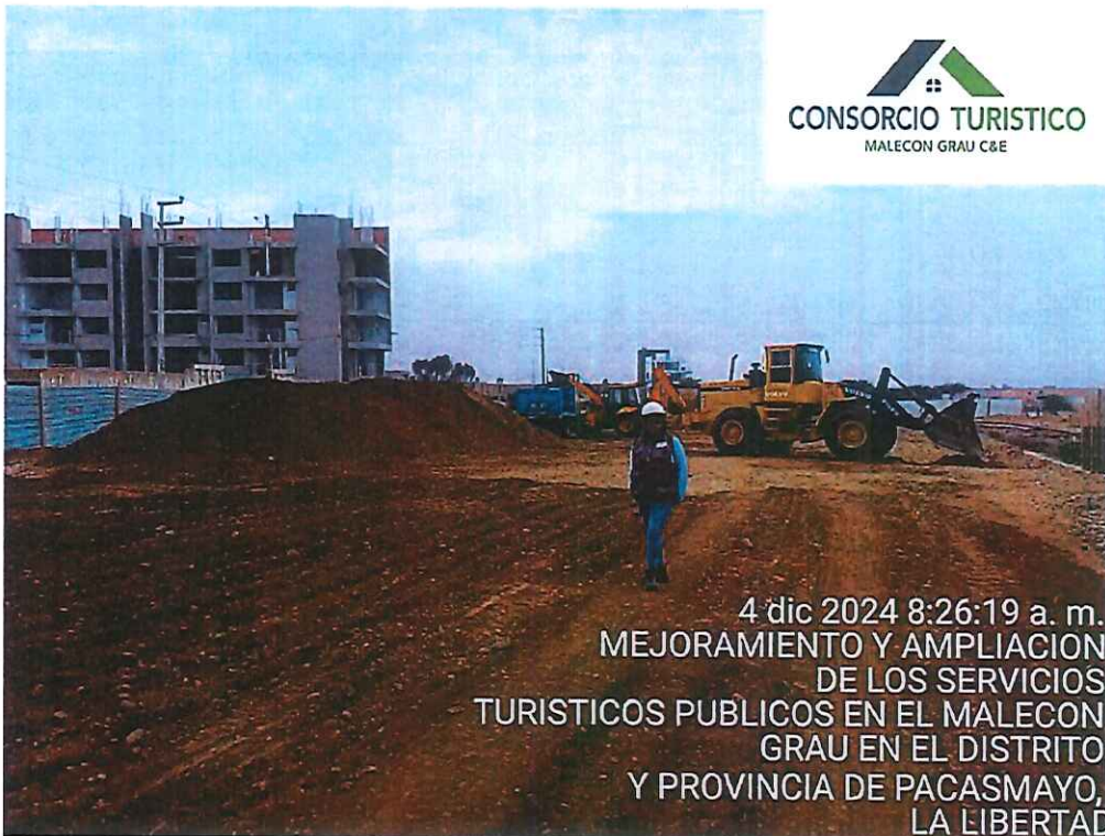
Imagen 2: Trabajos de movimiento de tierras relleno c/maquinaria