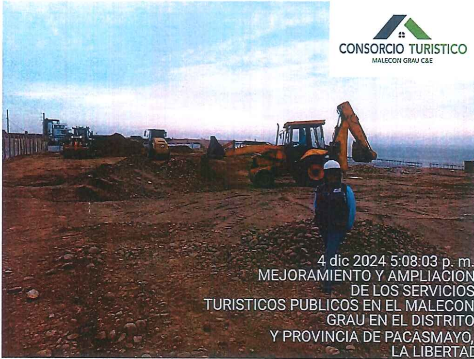
Imagen 3: Trabajos de movimiento de tierras relleno c/maquinaria