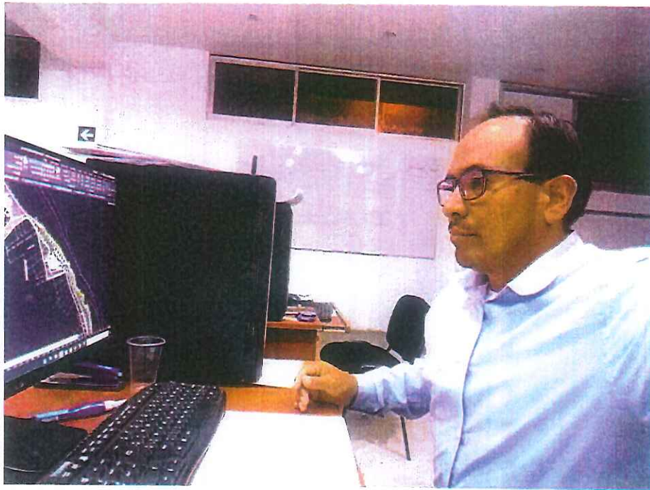
IMAGEN DEL TRABAJO DE OFICINA DEL AREA DE TOPOGRAFIA