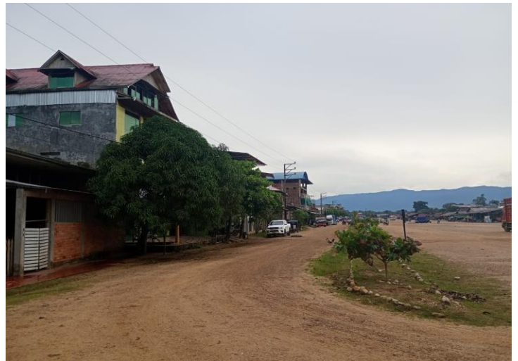
VISTA FRONTAL Y LATERAL DE LA CASA HOGAR GAVINO UBICADO EN LA CALLE CAPITAN LARRY EN LA LOCALIDAD DE PUERTO BERMUDEZ, PROXINCOA DE OXAPAMPA, DEPARTAMENTO DE PASCO