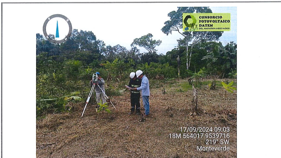
Foto 19. : Se muestra realizando el Replanteo Topográfico de los Sistemas Fotovoltaicos Centralizados, en la localidad de Monte Verde.