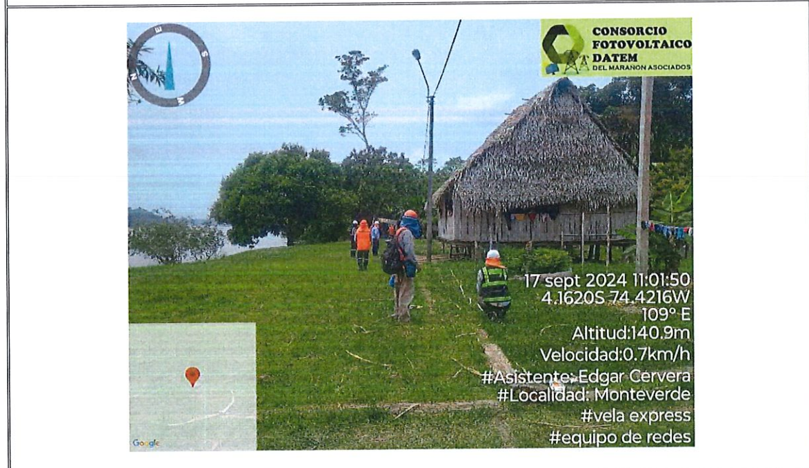
Foto 12. : Se muestra realizando el Replanteo Topográfico, Ubicación de Estructuras en Redes Secundarias, en la localidad de Monte Verde.