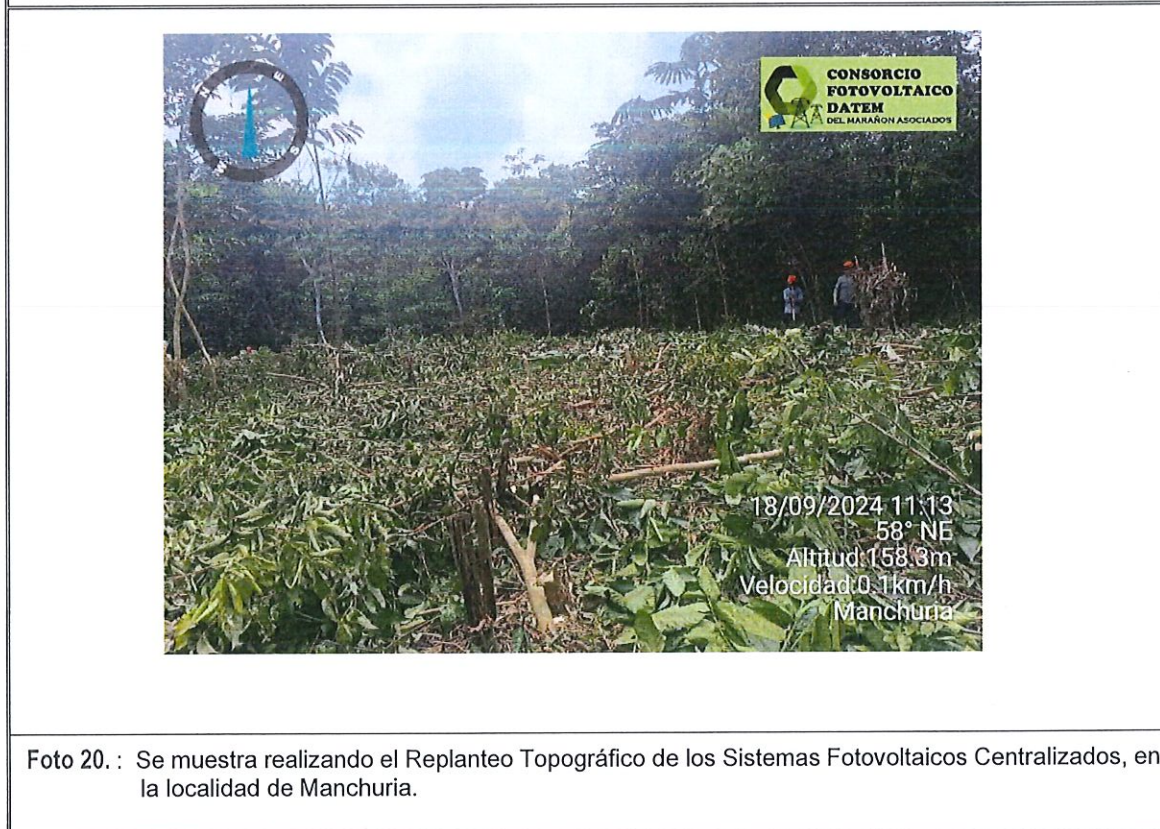
Foto 20. : Se muestra realizando el Replanteo Topográfico de los Sistemas Fotovoltaicos Centralizados, en la localidad de Manchuria.