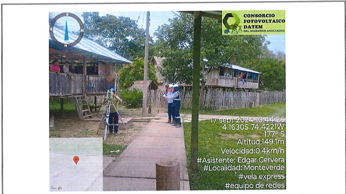
Foto 11. : Se muestra realizando el Replanteo Topográfico, Ubicación de Estructuras en Redes Secundarias, en la localidad de Monte Verde.