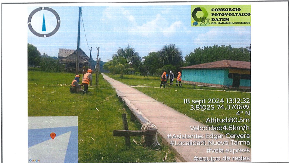
Foto 9. : Se muestra realizando el Replanteo Topográfico, Ubicación de Estructuras en Redes Secundarias, en la localidad de Nuevo Tarma.