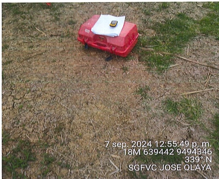
Foto 21. : Se muestra realizando el Replanteo Topográfico de los Sistemas Fotovoltaicos Centralizados, en la localidad de José Olaya.