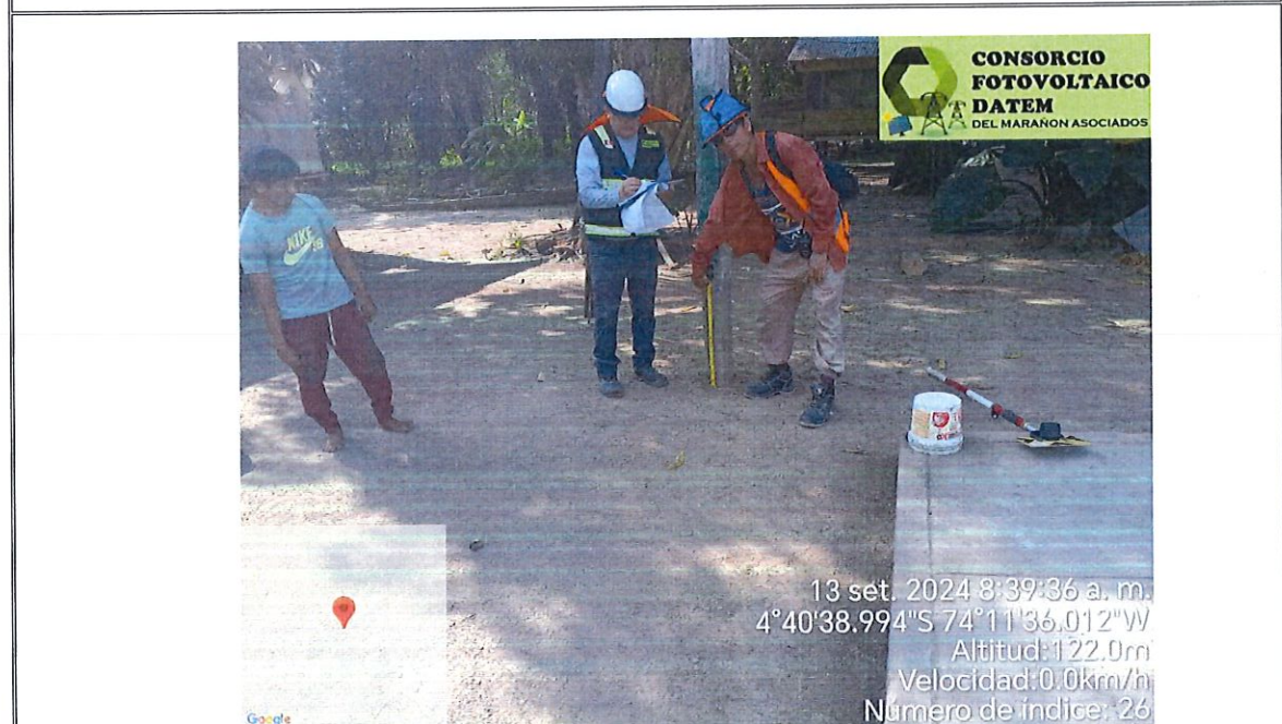
Foto 14. : Se muestra realizando el Replanteo Topográfico, Ubicación de Estructuras en Redes Secundarias, en la localidad de San Miguel.