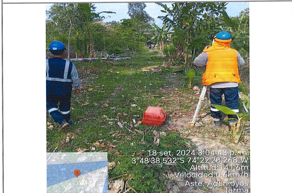
Foto 10. : Se muestra realizando el Replanteo Topográfico, Ubicación de Estructuras en Redes Secundarias, en la localidad de Nuevo Tarma.

CONSORCIO FOTOVOLTAICO DATEM DEL MARAÑÓN ASOCIADOS