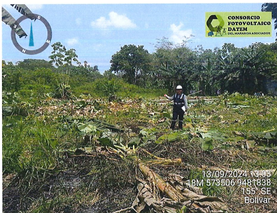
Foto 22. : Se muestra realizando el Replanteo Topográfico de los Sistemas Fotovoltaicos Centralizados, en la localidad de Bolívar.

CONSORCIO FOTOVOLTAICO DATEM DEL MARAÑON ASOCIADOS