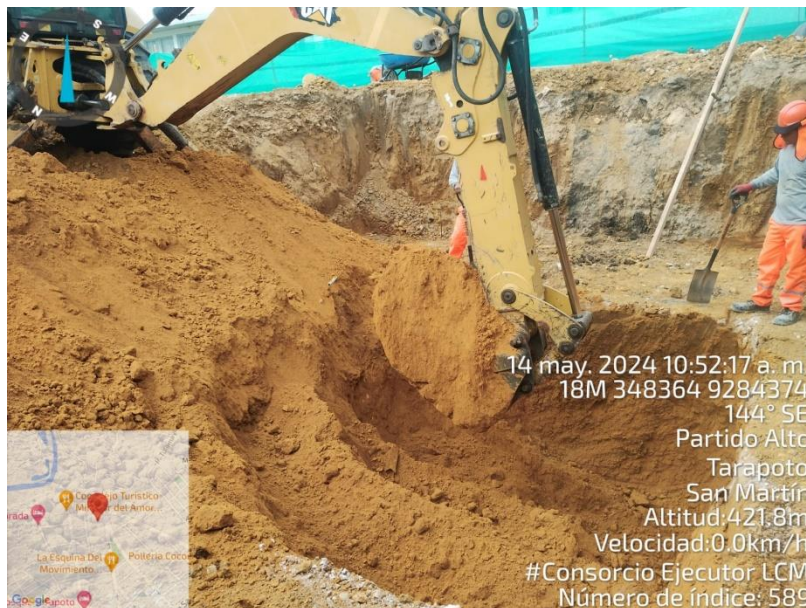
Fotografía N° 08: EXCAVACION CON MAQUINARIA AREA DE CISTERNA