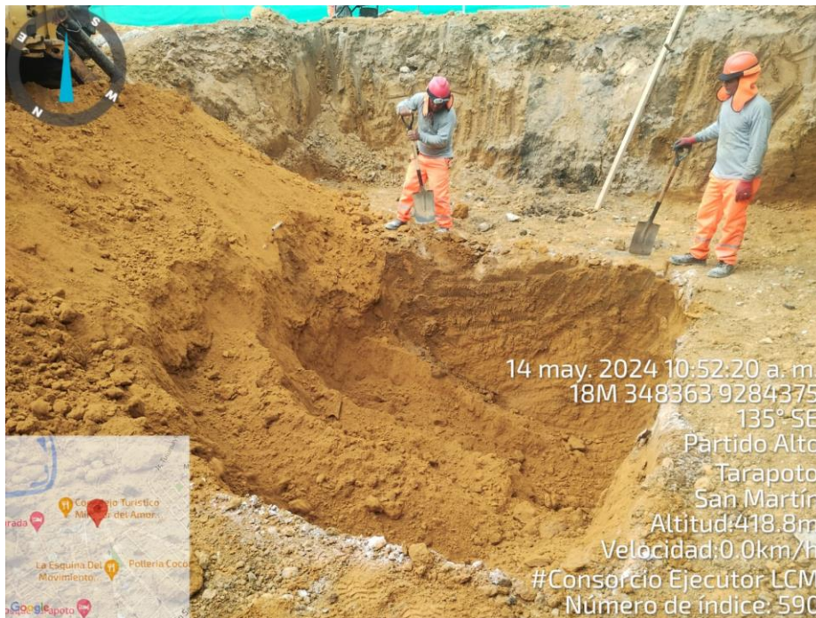
Fotografía N° 07: EXCAVACION CON MAQUINARIA Y MANUAL EN AREA DE CISTERNA

“CONSTRUCCION DE SALA DE HEMODIALISIS, ADQUISICION DE MAQUINA DE HEMODIALISIS, SILLON DE HOMODONACION Y COCHE DE PARO EQUIPADO; ADEMAS DE OTROS ACTIVOS EN EL (LA) EESS HOSPITAL TARAPOTO – TARAPOTO EN LA LOCALIDAD DE TARAPOTO, DISTRITO DE TARAPOTO, PROVINCIA SAN MARTIN, DEPARTAMENTO DE SAN MARTIN”