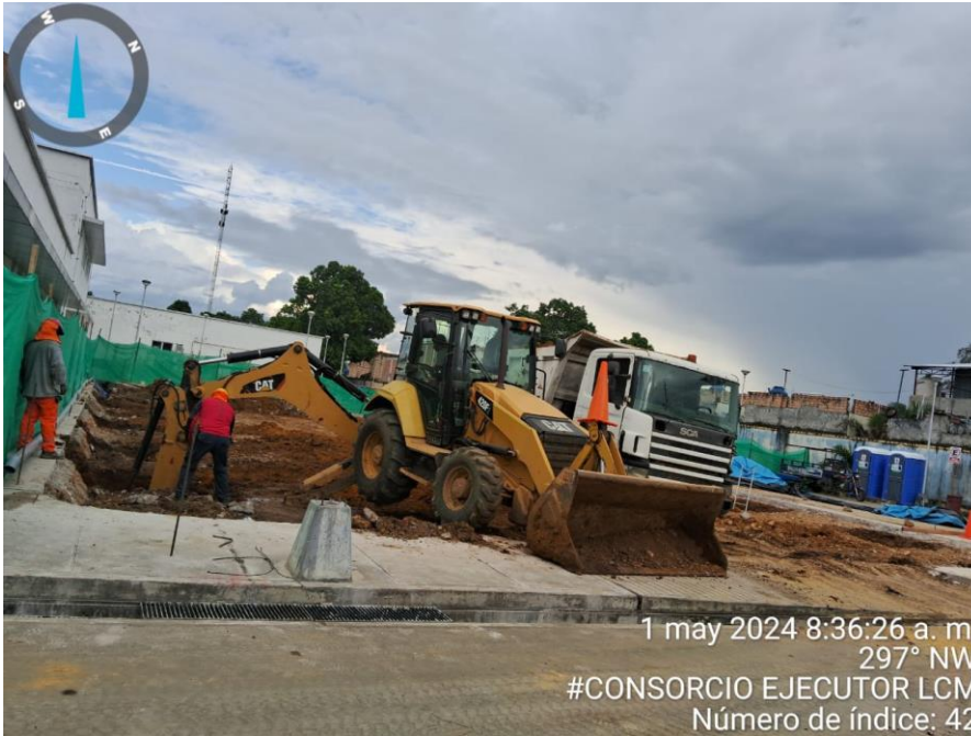
Fotografía N° 01: EXCAVACION CON MAQUINARIA LAS ZANJAS DE ZAPATA

“CONSTRUCCION DE SALA DE HEMODIALISIS, ADQUISICION DE MAQUINA DE HEMODIALISIS, SILLON DE HOMODONACION Y COCHE DE PARO EQUIPADO; ADEMAS DE OTROS ACTIVOS EN EL (LA) EESS HOSPITAL TARAPOTO – TARAPOTO EN LA LOCALIDAD DE TARAPOTO, DISTRITO DE TARAPOTO, PROVINCIA SAN MARTIN, DEPARTAMENTO DE SAN MARTIN”