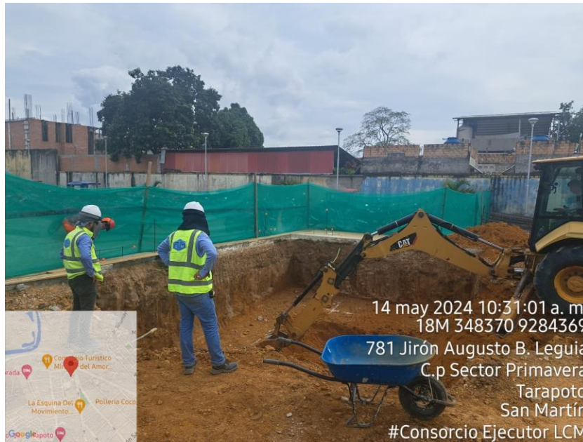
Fotografía N° 06: EXCAVACION CON MAQUINARIA AREA DE CISTERNA