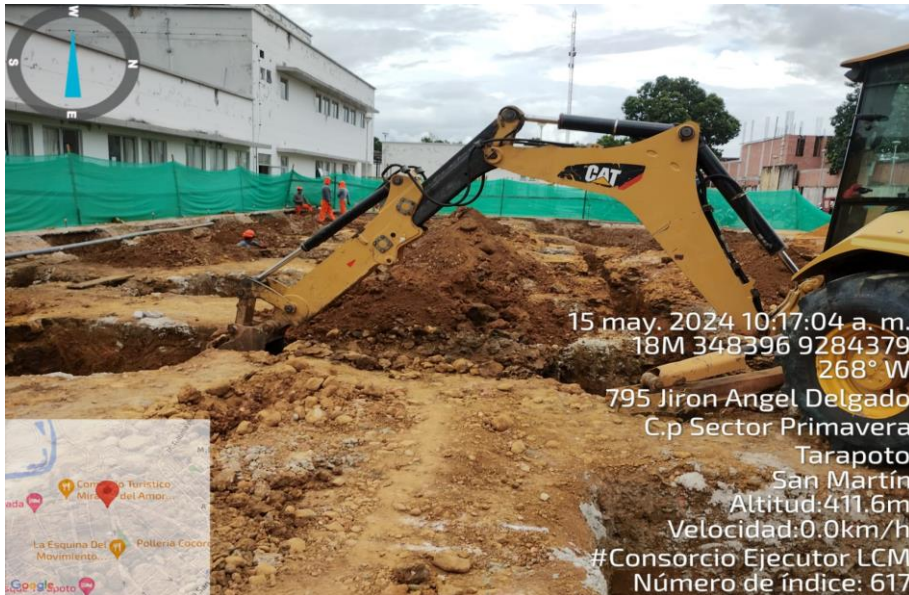
Fotografía N° 09: EXCAVACION CON MAQUINARIA LAS ZANJAS DE ZAPATA

“CONSTRUCCION DE SALA DE HEMODIALISIS, ADQUISICION DE MAQUINA DE HEMODIALISIS, SILLON DE HOMODONACION Y COCHE DE PARO EQUIPADO; ADEMAS DE OTROS ACTIVOS EN EL (LA) EESS HOSPITAL TARAPOTO – TARAPOTO EN LA LOCALIDAD DE TARAPOTO, DISTRITO DE TARAPOTO, PROVINCIA SAN MARTIN, DEPARTAMENTO DE SAN MARTIN”