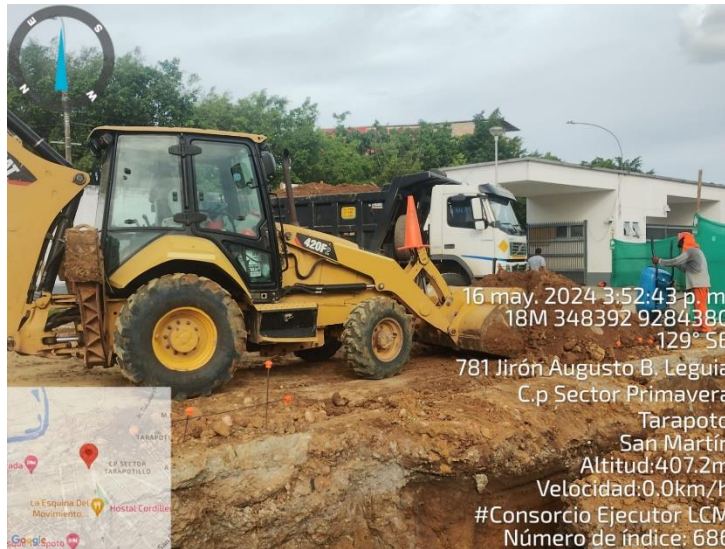
Fotografía N° 11: TRASLADO DE MATERIAL SOBRANTE

16 may. 2024 3:52:43 p. m. 18M 348392 9284380 129° SE 781 Jirón Augusto B. Leguía C.p Sector Primavera Tarapoto San Martín Altitud:407.2m Velocidad:0.0km/h #Consortio Ejecutor LCM Número de índice: 686