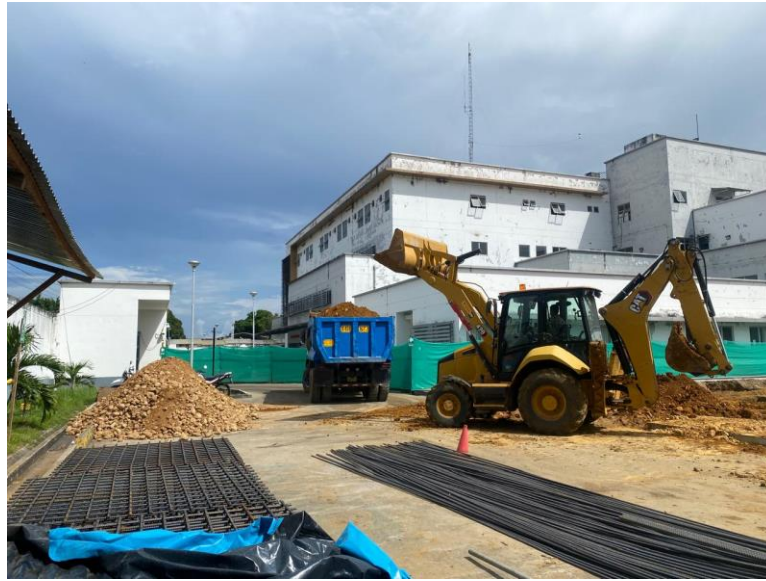
Fotografía N° 05: TRASLADO DE MATERIAL SOBRANTE

“CONSTRUCCION DE SALA DE HEMODIALISIS, ADQUISICION DE MAQUINA DE HEMODIALISIS, SILLON DE HOMODONACION Y COCHE DE PARO EQUIPADO; ADEMAS DE OTROS ACTIVOS EN EL (LA) EESS HOSPITAL TARAPOTO – TARAPOTO EN LA LOCALIDAD DE TARAPOTO, DISTRITO DE TARAPOTO, PROVINCIA SAN MARTIN, DEPARTAMENTO DE SAN MARTIN”