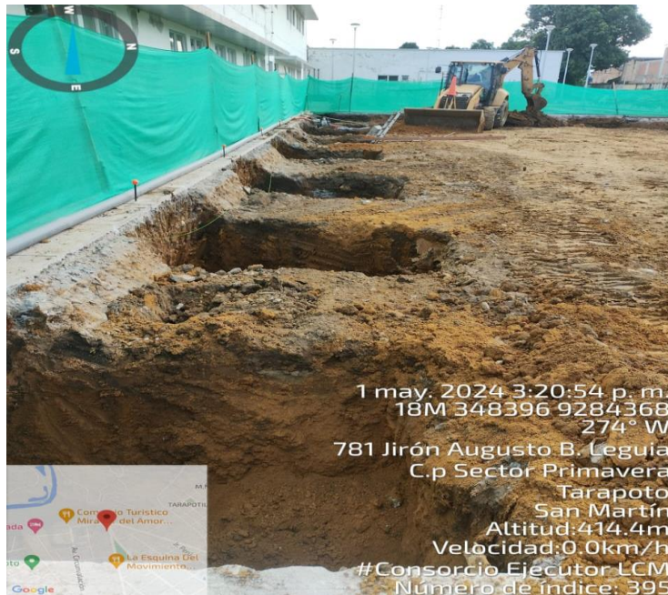
Fotografía N° 02: EXCAVACION CON MAQUINARIA LAS ZANJAS DE ZAPATA