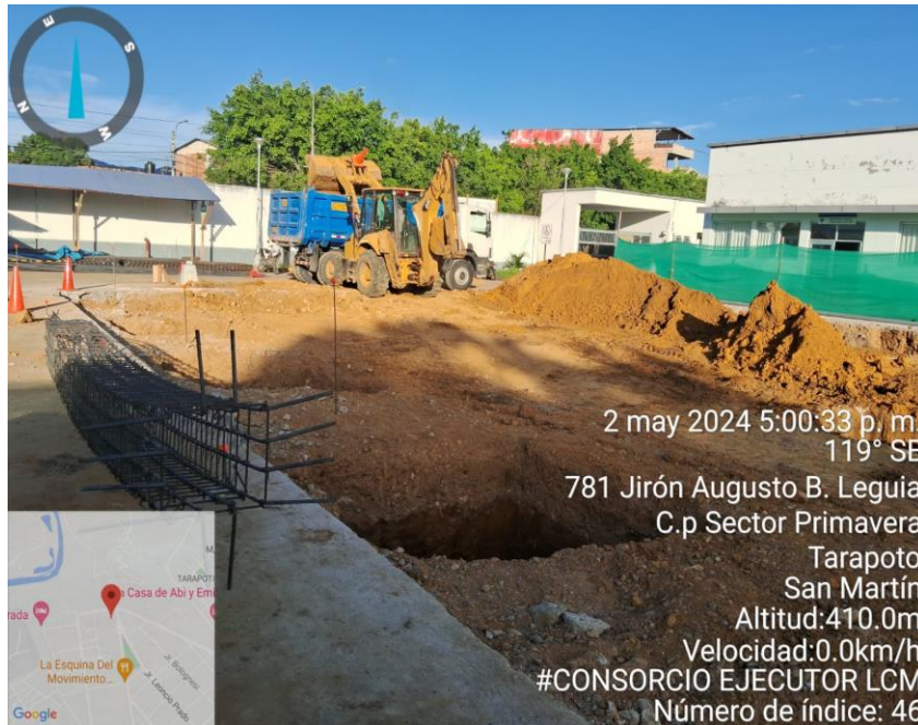
Fotografía N° 03: TRASLADO DE MATERIAL SOBRANTE

“CONSTRUCCION DE SALA DE HEMODIALISIS, ADQUISICION DE MAQUINA DE HEMODIALISIS, SILLON DE HOMODONACION Y COCHE DE PARO EQUIPADO; ADEMAS DE OTROS ACTIVOS EN EL (LA) EESS HOSPITAL TARAPOTO – TARAPOTO EN LA LOCALIDAD DE TARAPOTO, DISTRITO DE TARAPOTO, PROVINCIA SAN MARTIN, DEPARTAMENTO DE SAN MARTIN”