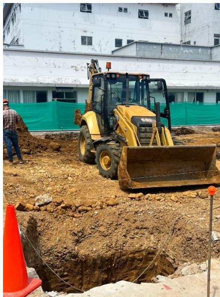
Fotografía N° 04: EXCAVACION CON MAQUINARIA LAS ZANJAS DE ZAPATA