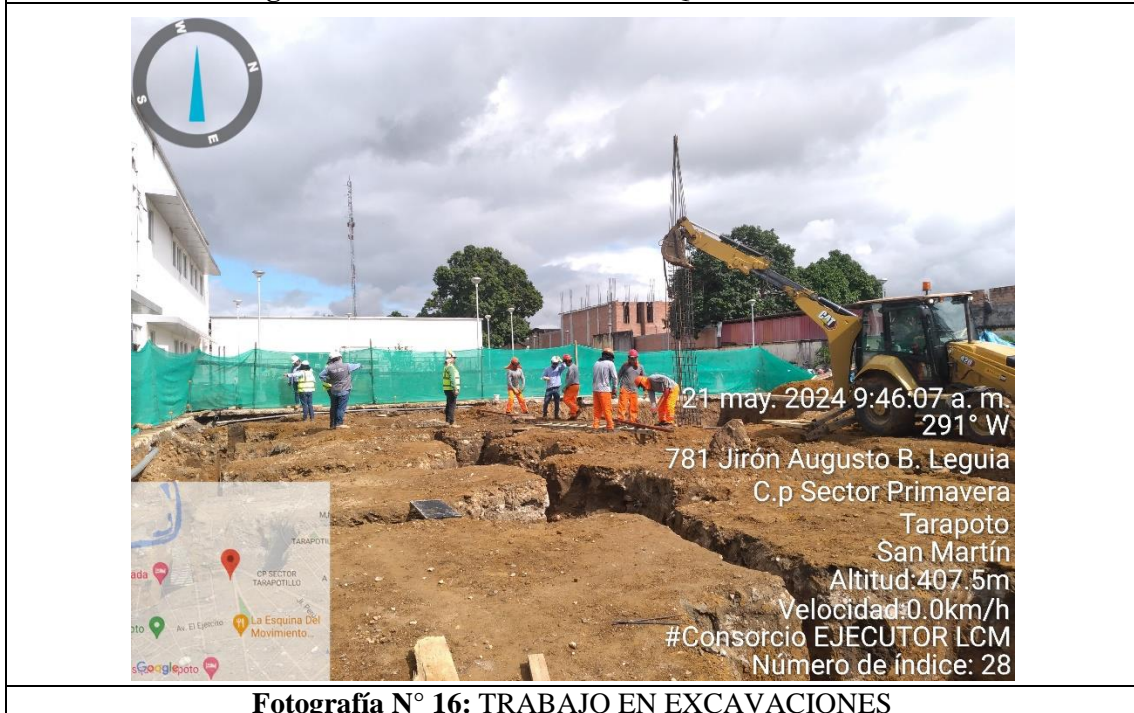
Fotografía N° 16: TRABAJO EN EXCAVACIONES