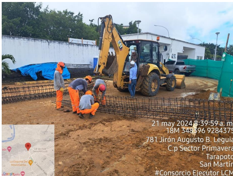
Fotografía N° 13: EXCAVACION CON MAQUINARIA LAS VIGAS DE CIMENTACION

21 may 2024 8:39:59 a. m. 18M 348396 9284375 781 Jirón Augusto B. Leguia C.p Sector Primavera Tarapoto San Martín #Consortio Ejecutor LCM