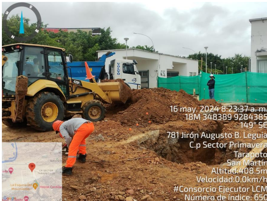
Fotografía N° 10: TRABAJOS CON MAQUINARIA PESADA