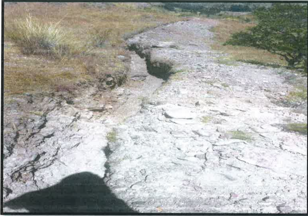
Vista de las rocas fracturadas y el canal despejado después de la voladura, destacando el resultado del trabajo realizado y la preparación del terreno para las siguientes etapas de construcción.