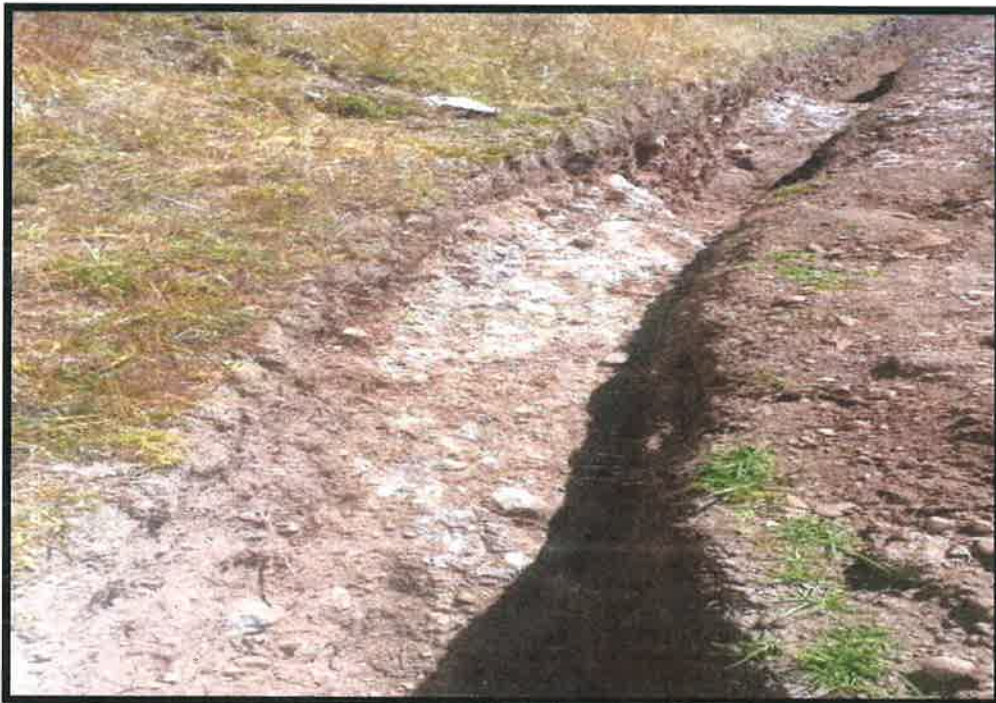
Vista panorámica del canal después de la voladura, mostrando detalladamente el área despejada y el progreso significativo en la preparación del terreno para las siguientes fases de construcción.