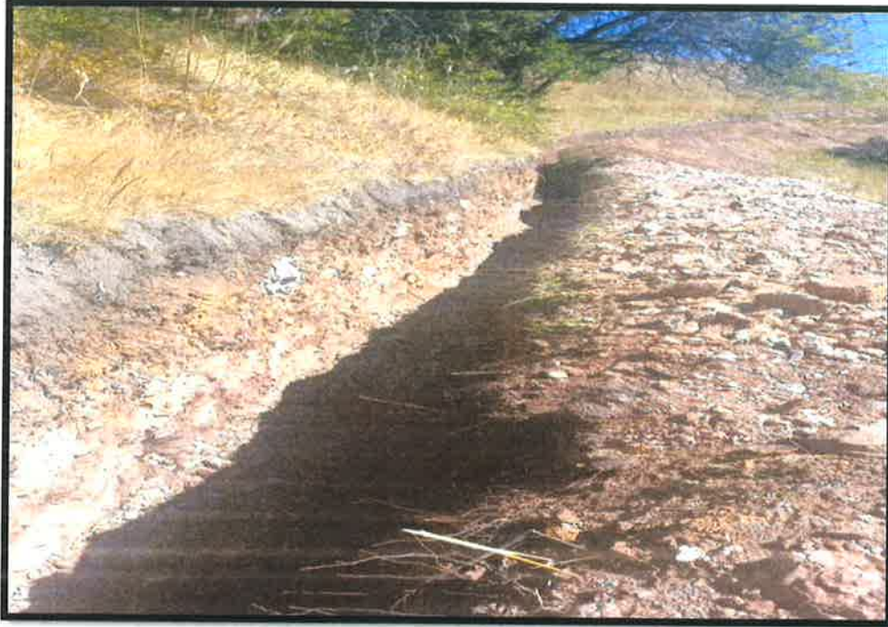
Vista del canal despejado después de la voladura de roca suelta, mostrando el área completamente libre de obstrucciones y lista para las siguientes etapas de la construcción.